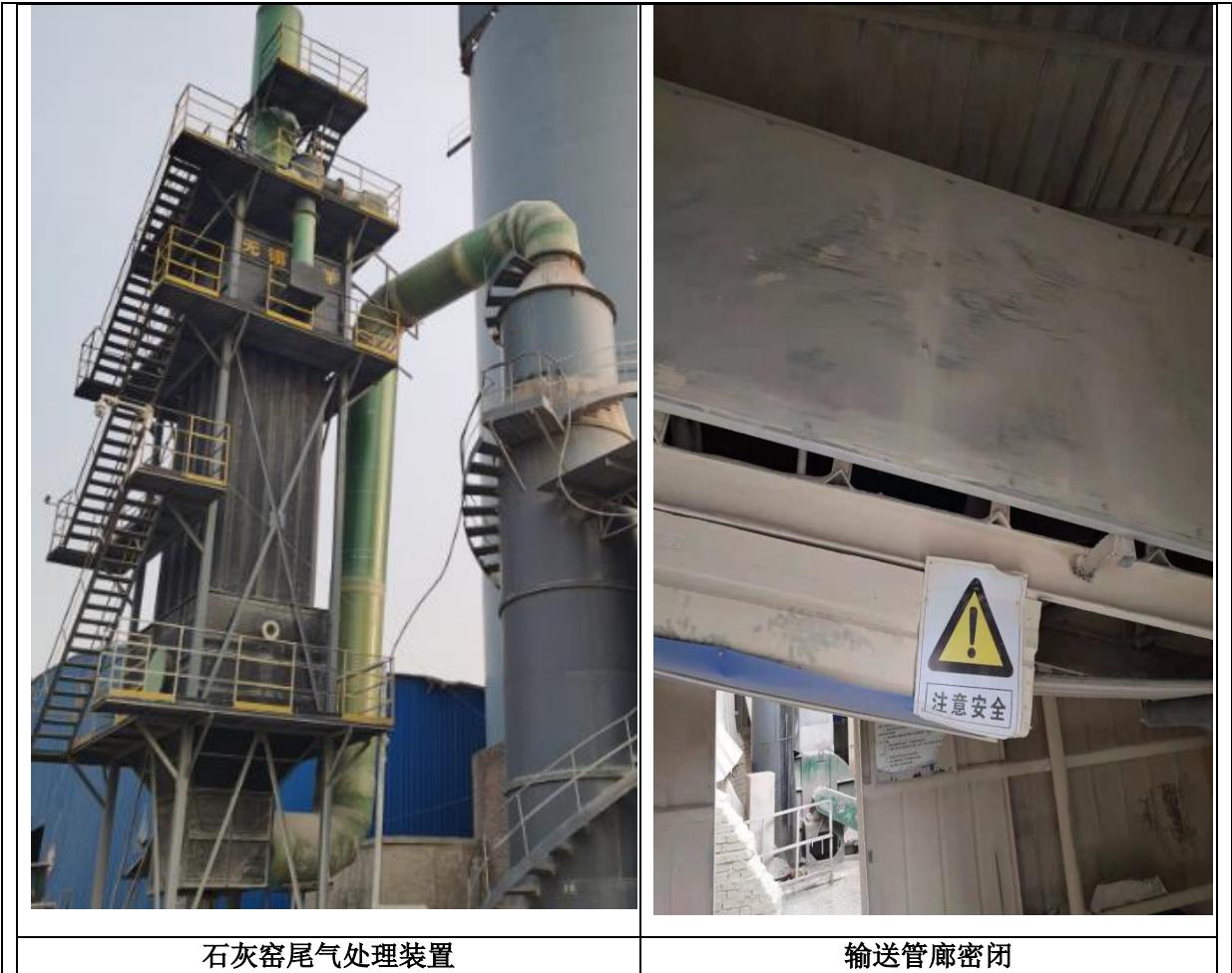
图 4 废气处置措施

本项目的噪声源主要来源于泵、风机、破碎机等，建设单位采取了选用低噪声设备、减振基础等；加强日常管理和维护保养等措施，降低对周围环境产生的影响。