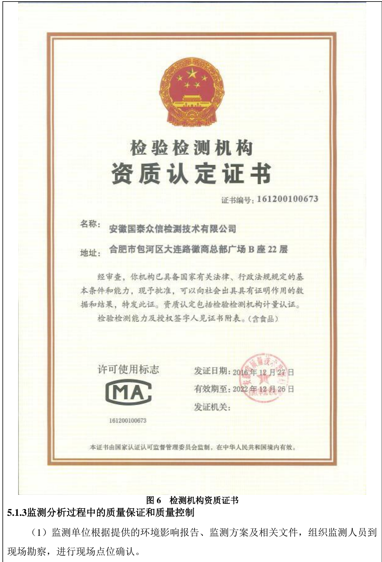
图 6 检测机构资质证书