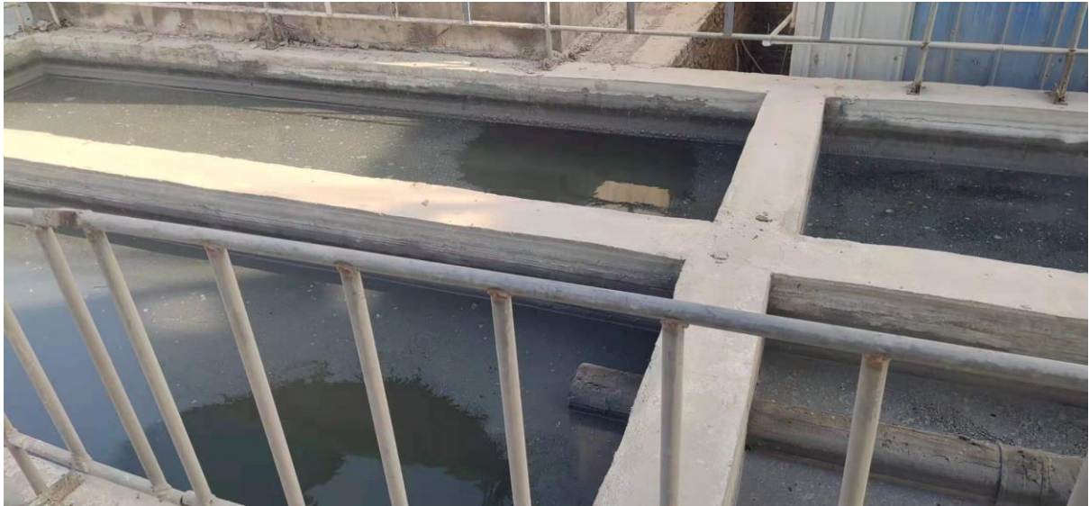
图 3 废水预处理设施（沉淀池）

项目营运期废水主要为生活污水，生活污水经化粪池预处理用于果树灌溉，生产废水经沉淀后回用，不外排。